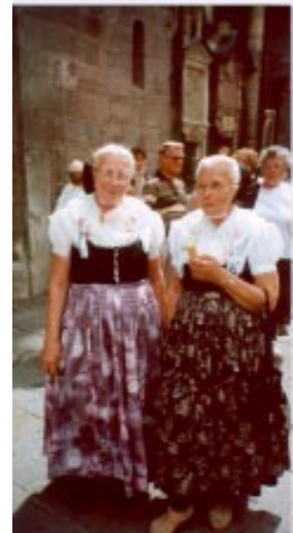
Frauen der „Reisegruppe Nebelschütz“ in sorbischer Tracht in Wien